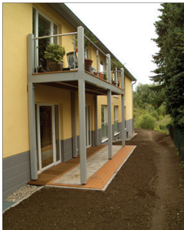
Impianto sul balcone con rivestimento aperto nella classe di utilizzo 3.

Nel fare questo, è necessario rispettare le distanze minimi delle viti rispetto al bordo laterale e al legno tagliato trasversalmente, come da indicazioni del produttore. La distanza minima dell'asse delle viti a filettatura piena rispetto al legno tagliato trasversalmente non deve essere inferiore a 40 mm; occorre assolutamente evitare una collisione delle viti con gli spinotti.